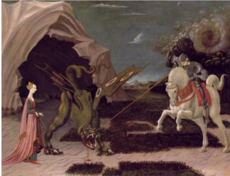
San Jorge y el Dragón por Paolo Uccello

Bajo la Orden Dominicana y la Inquisición , ellos fueron traídos a pagar por sus herejías, aunque los crímenes en contra de ellos, de esta fuente, eran solo una parte de lo que habrían tenido que aguantar.